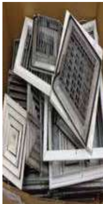
Por donar ventiladores de aire