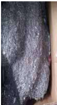
Por donar 76 lbs. de grapas