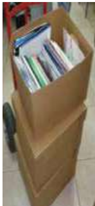
Por donar revistas y papelería varias