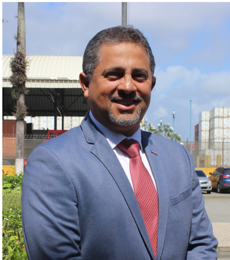
"Voluntad, Consenso y Compromiso"