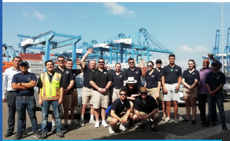
| Massachusetts Maritime Academy