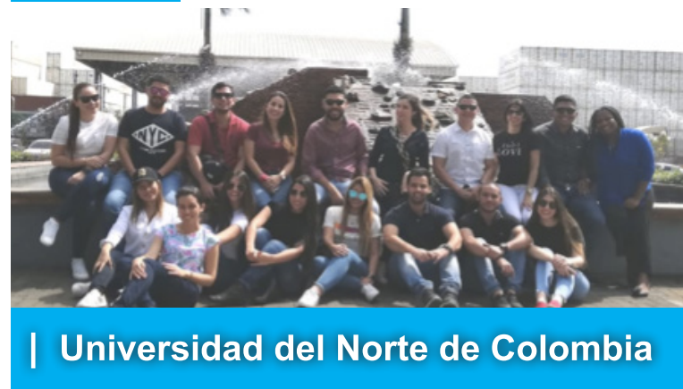
| Universidad del Norte de Colombia