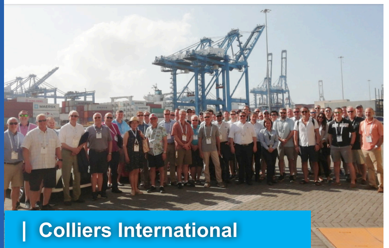
| Colliers International