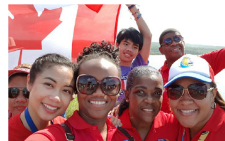
Voluntarios MIT compartieron con 400 peregrinos de diferentes países en el Fuerte San Lorenzo.

La Jornada Mundial de la Juventud Panamá 2019 atrajo más de 70,000 peregrinos, 7 presidentes, 1 príncipe, 5 primeras damas y al Papa Francisco. Más de 20 mil agentes de seguridad y salud se pusieron al servicio de esta actividad, así como 20 mil voluntarios y familias de acogida, entre ellos, colaboradores de MIT. Algunos de ellos compartieron fotos que apenas recogen esta gran experiencia de convivencia y amor fraterno.