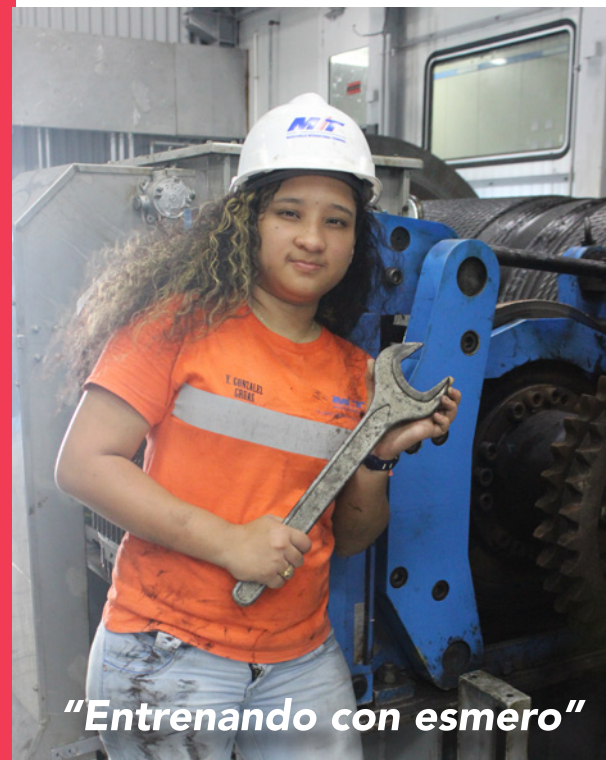
"Entrenando con esmero"

Con 18 años de existencia y sede en ciudad de Panamá, brindan servicios integrales a nivel nacional e internacional. En su búsqueda de soluciones logísticas al transporte de la carga, confía en los servicios de MIT, como terminal portuaria de referencia en la región, eficiente y cuya atención al cliente en materia operativa y cotizaciones la califica como A+. Su primer gran proyecto lo movió en MIT. Está involucrado como Presidente de la Asociación Panameña de Agencias de Carga (APAC) en la creación de la "Brigada Logística de Apoyo", quienes en caso de desastre entregarán la ayuda humanitaria al lugar donde se requiera, junto al SINAPROC.