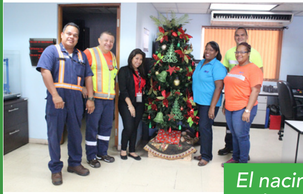
El nacimiento de Jesús unió a la familia MIT alrededor de sus propios árboles de Navidad. Espectacular!