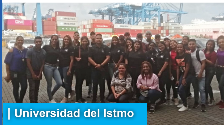
| Universidad del Istmo