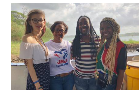
Sudafrica y Polonia Jovira Joly