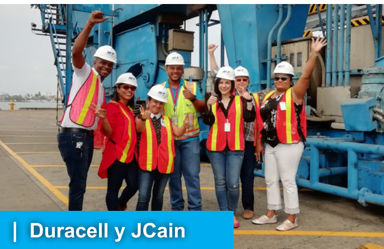
| Duracell y JCain