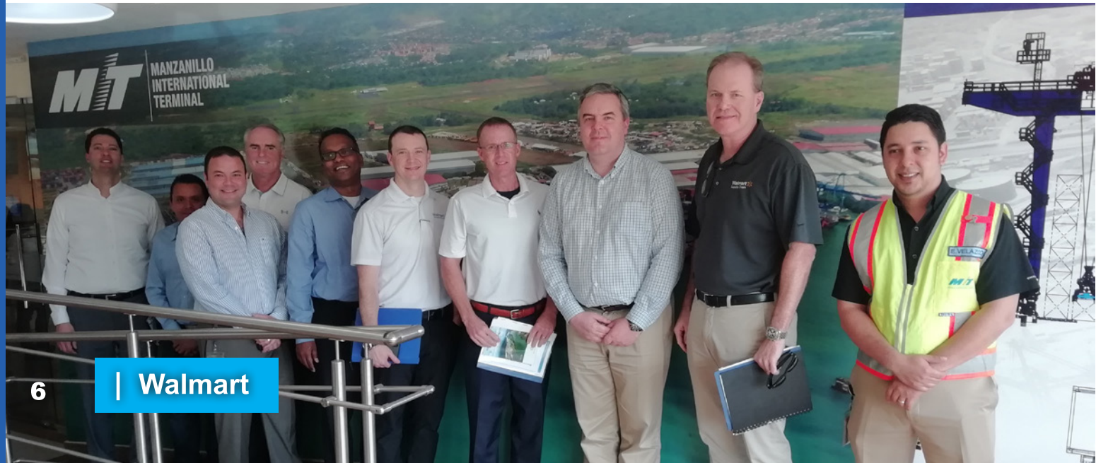
6 | Walmart